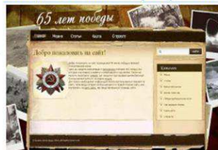
Электронная экспозиция музея гимназии